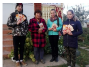
Экскурсия в Музей го истории народно- образования в МБУДОЦДЮТ «Путник».

Волонтеры и активисты "Молодой Гвардии" с.Мишкино поздравили с Днем пожилых людей пенсио- неров-мишкинцев. Ребята вручили пожилым гражданам открытки с пожеланиями крепкого здоровья и мирного неба.